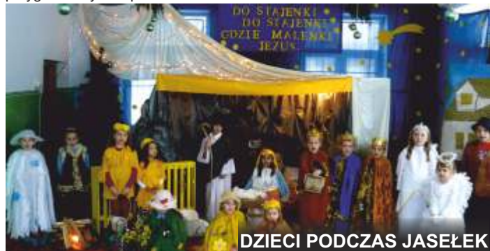
DZIECI PODCZAS JASEŁEK

Takie uroczystości wpływają na wzmocnienie więzi emocjonalnej dzieci z rodziną oraz kształtowanie uczucia przywiązania i szacunku dla dziadków.