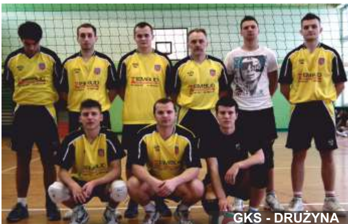
GKS - DRUŻYNA

W półfinale GUKS Modliborzycy zmierzy się z „Yellowstone” Kraśnik, druga para półfinałowa to KS GOK Trzydnik Duży I z „Trójką” Kraśnik. Wygrane zespoły zagrają o pierwsze miejsce, a przegrani o trzecie. Zapraszamy do kibicowania naszej drużynie podczas finału ligi.