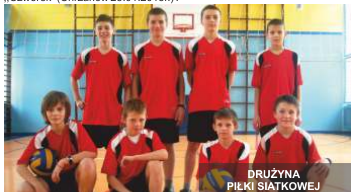
DRUŻYNA PIŁKI SIATKOWEJ