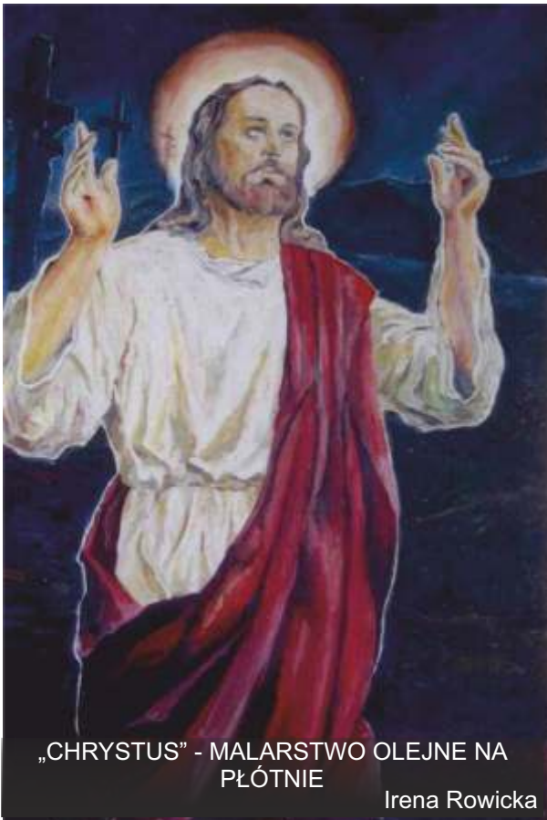
„CHRYSTUS” - MALARSTWO OLEJNE NA PŁÓTNIE