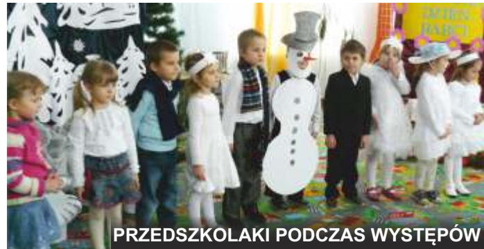
PRZEDSZKOLAKI PODCZAS WYSTĘPÓW

Uroczystość z tej okazji odbyła się 21 stycznia 2013 r. W przygotowanie jej wychowawcy włączyli dzieci i ich rodziców – wspólne wykonanie upominków oraz przygotowanie poczęstunku.