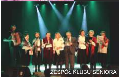
ZESPÓŁ KLUBU SENIORA