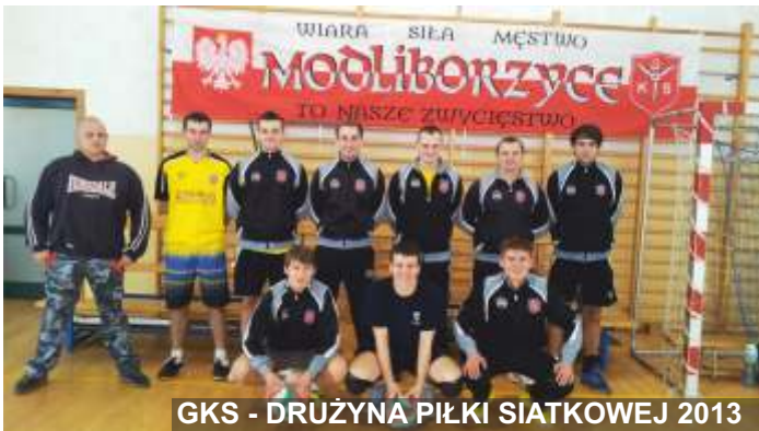
GKS - DRUŻYNA PIŁKI SIATKOWEJ 2013

Turniej nr 4 – Trzydnik Duży 10.03.2013r.