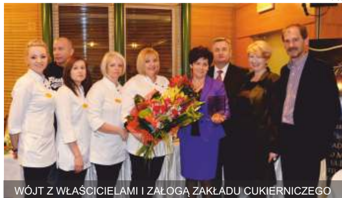
WÓJT Z WŁAŚCICIELAMI I ZAŁOGĄ ZAKŁADU CUKIERNICZEGO