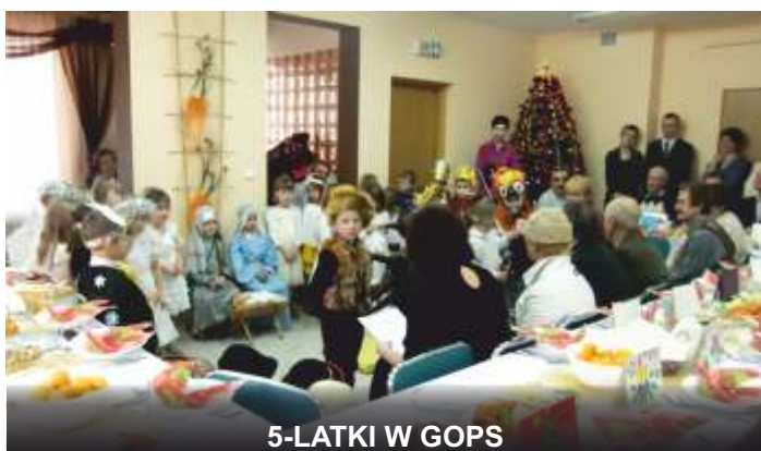
5-LATKI W GOPS