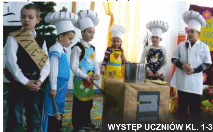
WYSTĘP UCZNIÓW KL. 1-3

Dnia 7 lutego 2013 r. odbył się bal przebierańców.