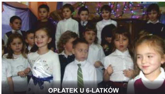
OPLATEK U 6-LATKÓW