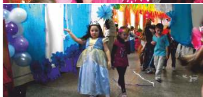
Nauczycielki Samorządowego Przedszkola w Modliborzycach