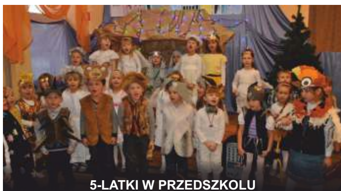
5-LATKI W PRZEDSZKOLU