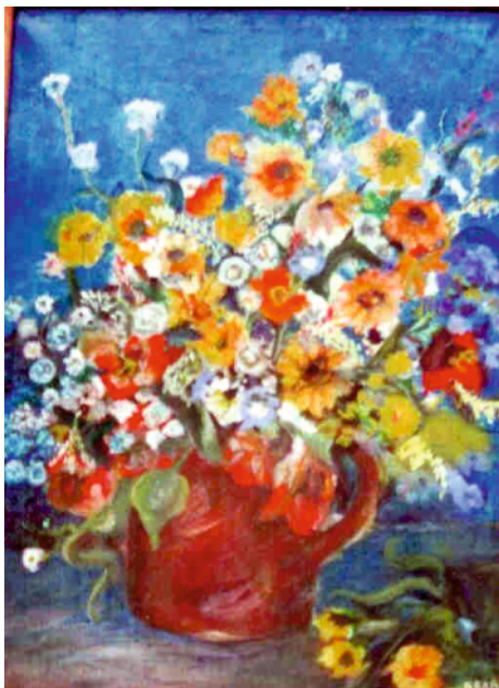
BUKIET NA NIEBIESKIM TLE - OBRAZ OLEJNY