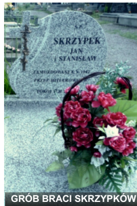
GRÓB BRACI SKRZYPKÓW

A gdy odjeżdżali z Osówka, podpalili dom stryja. Wcześniej jeden jakiś miłosierny Niemiec ostrzegł stryjenkę, żeby zabrała cenniejsze rzeczy i dzieci, co nas było razem pięcioro sierot i kazała uciekać, bo będą palić. Podobno Szpyt spotrafił nawet wrzucić do ognia rzeczy, które stryjna ocalała. Z nami uciekła na gajówkę. Mama nasza powiedziała: „Opiekuj się, stryjno, dziećmi” i poszła na Brzeziny wysłać babcię, ażeby podpatrzyła, gdzie naszych pochowali. Ich jak psów, dwóch braci do jednego dołu zakopali na cmentarzu w Modliborzycach. Tych dwóch partyzantów niedaleko po tej samej stronie cmentarza. A tam na ojcowiznie, gdzie ściekała z nich krew, w ogóle las nie rośnie, jest do dziś pusty plac.