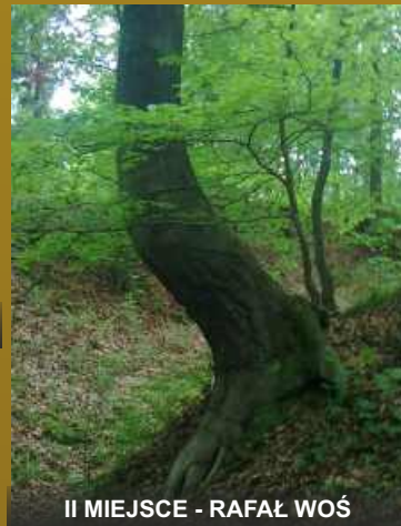
II MIEJSCE - RAFAŁ WOŚ