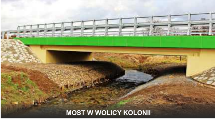
MOST W WOLICY KOŁONII

Za te pieniądze został wyremontowany most i przebudowana droga o długości 2,5 kilometra, na której wzmocniono podbudowę, położono asfaltową nawierzchnię i wybudowano zatokę autobusową. Samorząd powiatowy z własnych środków wyłożył na ten cel 400 tysięcy złotych, Gmina Modliborzyce – 500 tysięcy złotych, a kolejnych 800 tysięcy pochodziło z budżetu państwa.