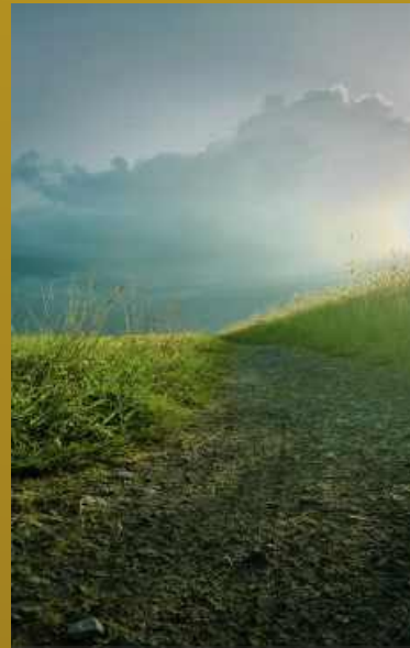
I MIEJSCE - DIANA RYCHLAK