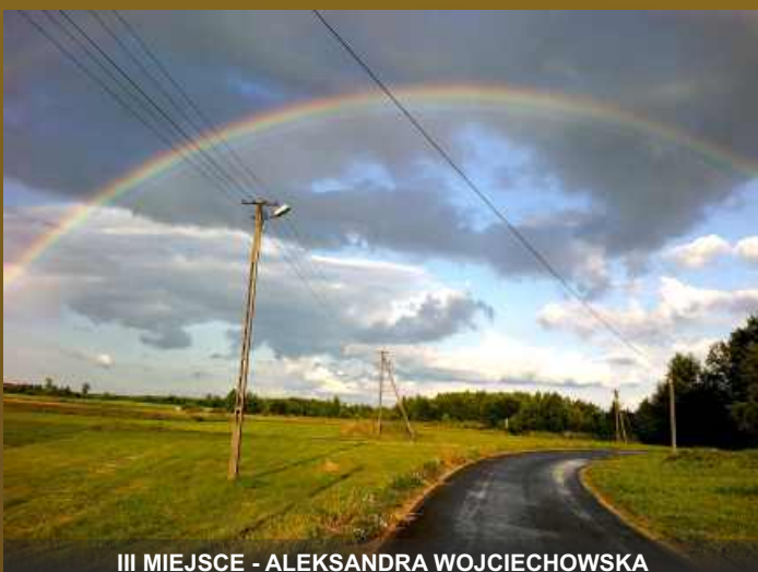
III MIEJSCE - ALEKSANDRA WOJCIECHOWSKA