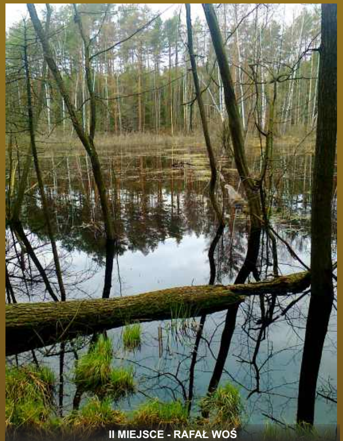
II MIEJSCE - RAFAŁ WOŚ