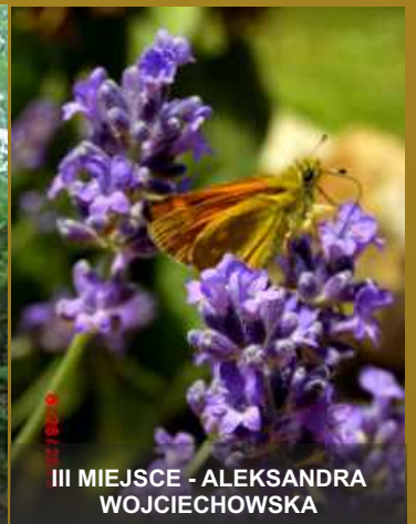
III MIEJSCE - ALEKSANDRA WOJCIECHOWSKA