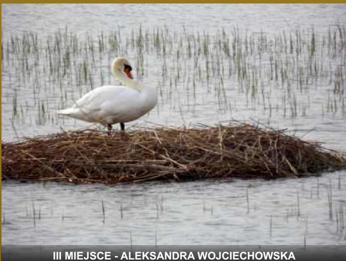
III MIEJSCE - ALEKSANDRA WOJCIECHOWSKA