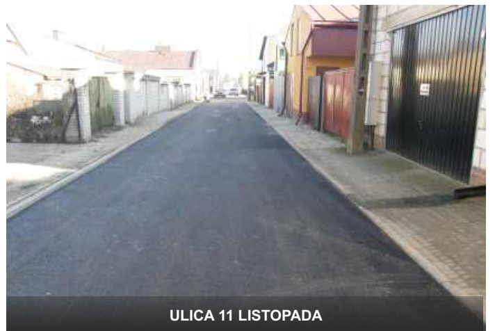
ULICA 11 LISTOPADA

Energetyczny planuje przebudowę istniejących linii oświetleniowych. Dzięki temu zostaną zlikwidowane m.in. słupy energetyczne w chodniku na ul. Janowskiej, a przewody zostaną zabezpieczone w instalacji ziemnej.