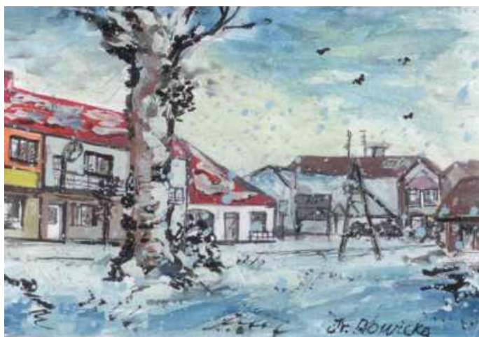
ULICA W MODLIBORZYCACH W ZIMOWEJ SZACIE - AKWARELA