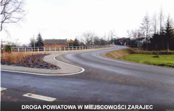
DROGA POWIATOWA W MIEJSCOWOŚCI ZARAJEC

2. Zakończone zostały prace prowadzone na drogach powiatowych nr 2802L Zarajec - Potok Wielki (odcinek od drogi krajowej nr 19 do remizy w Zarajcu), nr 2742L Huta Józefów - Zarajec (od szkoły w Hucie Józefów do remizy w Zarajcu), 2743L Polichna - Huta Józefów - Potok Stany (odcinek od szkoły w Hucie Józefów do skrzyżowania z drogą powiatową nr 2718L w miejscowości Potok Stany). W ramach robót budowlanych wykonano nowe nawierzchnie asfaltowe na długości ponad 6,6 km, wybudowano chodnik w Zarajcu na długości 1,2 km, wykonano renowację rowów odwadniających wraz ze zjazdami, wykonano również oznakowanie pionowe i poziome, przebudowano skrzyżowania w miejscowości Zarajec. Roboty budowlane prowadzone były od kwietnia.