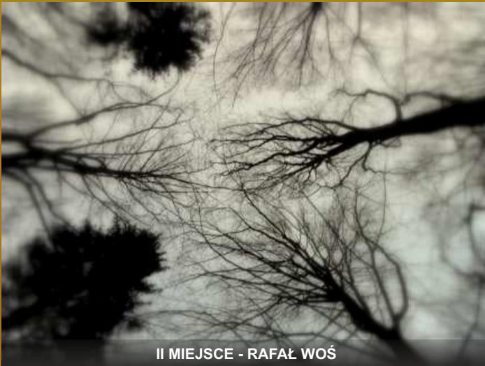
II MIEJSCE - RAFAŁ WOŚ