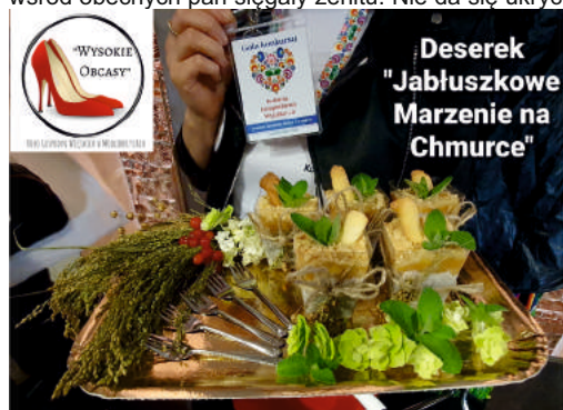
Deserek "Jabłuszkowe Marzenie na Chmurce"

Gdy wreszcie nadszedł czas ogłoszenia wyników – emocje wśród obecnych pań sięgały zenitu. Nie da się ukryć, że i nasze panie po