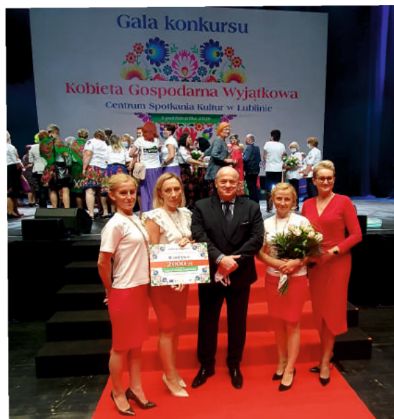
Zarząd KGW „Wysokie Obcasy” w Modliborzycach