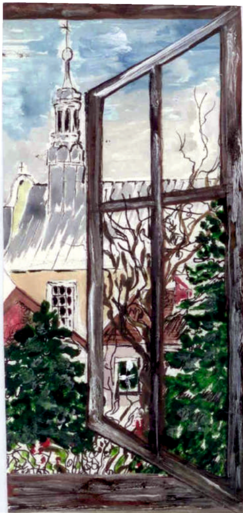
Przez otwarte okno I. Rowicka

Dane, dotyczące statystyki urodzeń i zgonów, podawane są na podstawie dokumentów otrzymywanych z innych Urzędów Stanu Cywilnego.