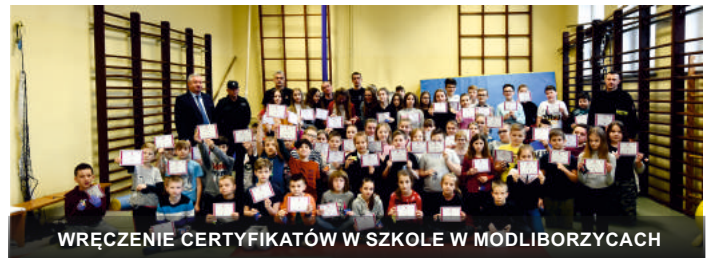
WRĘCZENIE CERTYFIKATÓW W SZKOLE W MODLIBORZYPACH