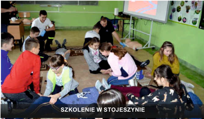
SZKOLENIE W STOJESZYNIE

Pierwsza pomoc to często jedyna szansa, by zapobiec tragedii. Dlatego tak ważne jest, by od najmłodszych lat oswajając dzieci z ideą pomagania.