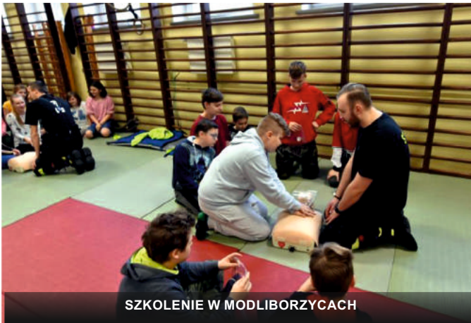
SZKOLENIE W MODLIBORZYPACH

Uczniowie ze szkół w gminie Modliborzycy już wiedzą jak udzielać pierwszej pomocy przedmedycznej. Uczyli się tego podczas cyklu szkoleń, które prowadzili miejscowi strażacy. Ostatni z takich kursów odbył się w czwartek 27 lutego 2020r. w Publicznej Szkole Podstawowej w Wierzchowiskach Drugich, a wcześniej podobne zajęcia druhowie poprowadzili w Zespole Placówek Oświatowych w Stojeszynie Pierwszym i Zespole Szkół w Modliborzycach. Łącznie w szkoleniu wzięło udział ponad 400 dzieci i młodzieży.