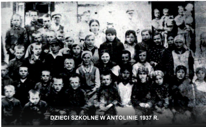
DZIECI SZKOLNE W ANTOLINIE 1937 R.