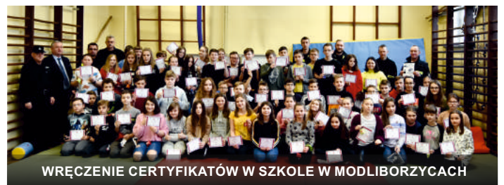
WRĘCZENIE CERTYFIKATÓW W SZKOLE W MODLIBORZYPACH