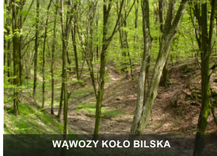
WĄWOZY KOŁO BILSKA