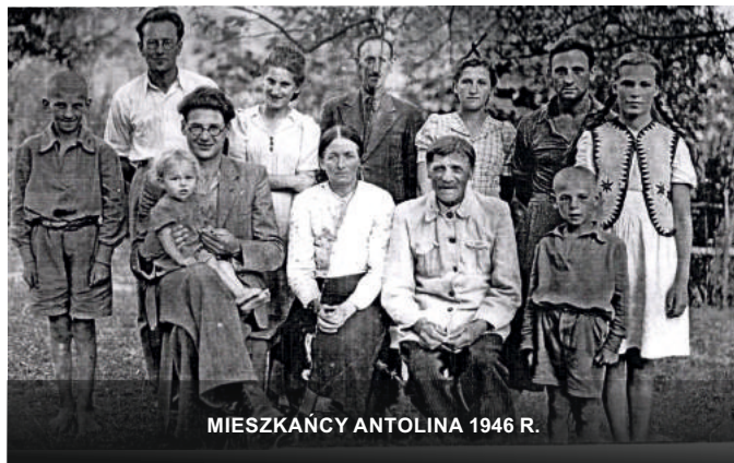
MIESZKAŃCY ANTOLINA 1946 R.