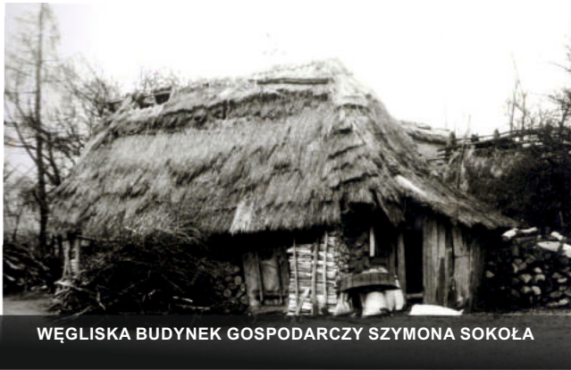
WĘGLISKA BUDYNEK GOSPODARCZY SZYMONA SOKOŁA