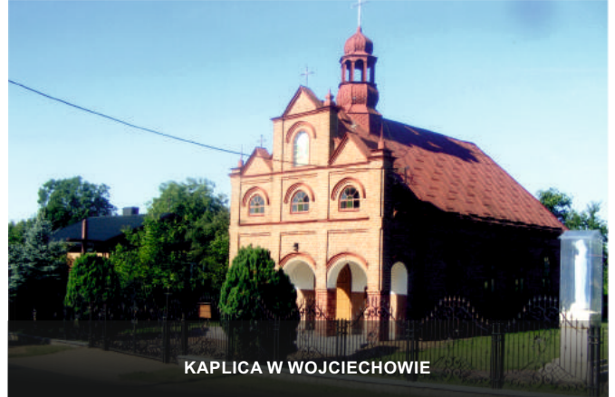
KAPLICA W WOJCIECHOWIE