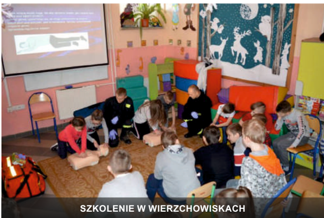
SZKOLENIE W WIERZCHOWISKACH

Uczniowie ze szkół w gminie Modliborzycy już wiedzą jak udzielać pierwszej pomocy przedmedycznej. Uczyli się tego podczas cyklu szkoleń, które prowadzili miejscowi strażacy. Ostatni z takich kursów odbył się w czwartek 27 lutego 2020r. w Publicznej Szkole Podstawowej w Wierzchowiskach Drugich, a wcześniej podobne zajęcia druhowie poprowadzili w Zespole Placówek Oświatowych w Stojeszynie Pierwszym i Zespole Szkół w Modliborzycach. Łącznie w szkoleniu wzięło udział ponad 400 dzieci i młodzieży.