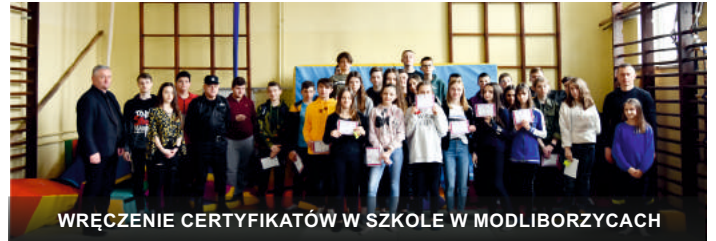
WRĘCZENIE CERTYFIKATÓW W SZKOLE W MODLIBORZYPACH