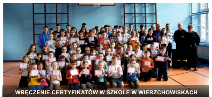
WRĘCZENIE CERTYFIKATÓW W SZKOLE W WIERZCHOWISKACH