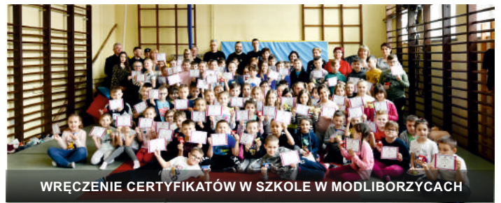
WRĘCZENIE CERTYFIKATÓW W SZKOLE W MODLIBORZYPACH