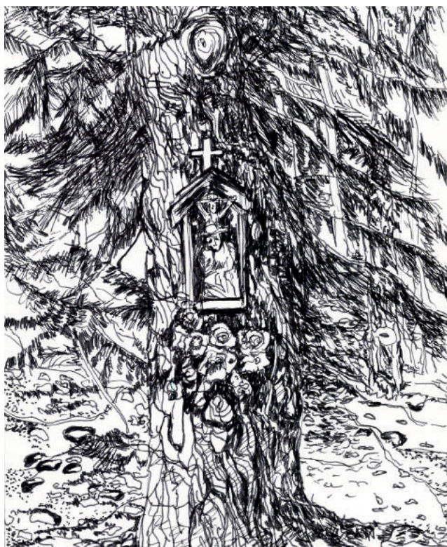
MAŁA KAPLICZKA NA DĘBIE W DRODZE DO CIECHOCINA - SZKIC RYSUNKOWY I. ROWICKA