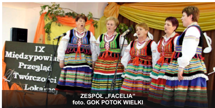
ZESPÓŁ „FACELIA”

12 października 2019 r. Gminny Ośrodek Kultury w Potoku Wielkim organizował kolejną edycję Międzypowiatowego Przeglądu Twórczości Lokalnej. Wśród występujących znalazły się również zespoły z naszej gminy; Zespół Śpiewaczy z GOK Modliborzycze, zespół „Facelia” z Wierzchowisk oraz Kapela Mazurów z Michałówki.