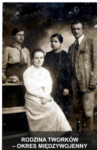
RODZINA TWORKÓW – OKRES MIĘDZYWOJENNY