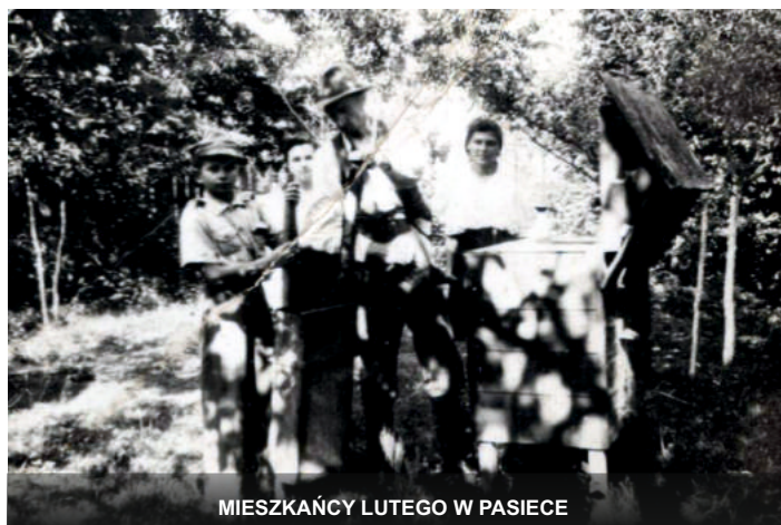
MIESZKAŃCY LUTEGO W PASIECE

dużą rzeką i prawie co roku zalewała łąki, przez które płynęła. Obecnie to mały strumyk wijący się wśród pól i łąk naszej modliborzycyckiej ziemi.