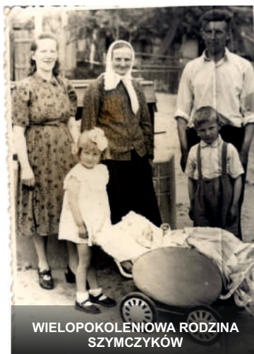
WIELOPOKOLENIOWA RODZINA SZYMZYKÓW

który był koniuszym w wojsku carskim. Staw ten do chwili obecnej znajduje się w rękach tej rodziny. Pod koniec XIX w. Lute wraz z kolonią liczyło 389 mieszkańców, w tym 262 kolonistów 5 .