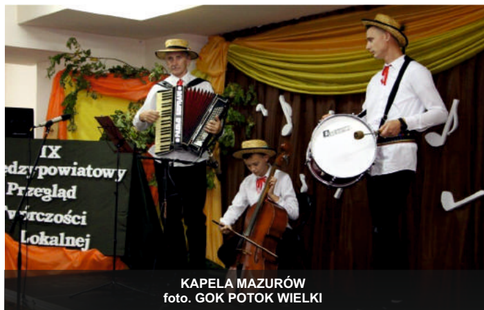
KAPELA MAZURÓW