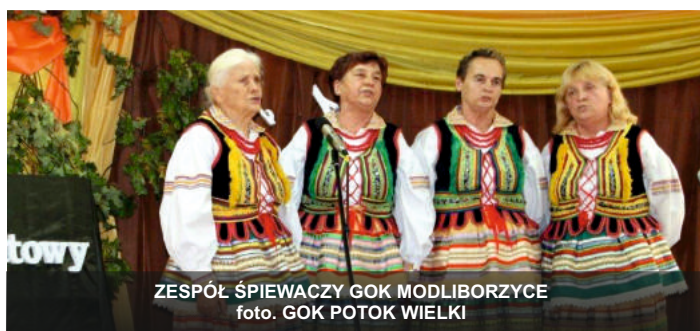
ZESPÓŁ ŚPIEWACZY GOK MODLIBORZYCZE