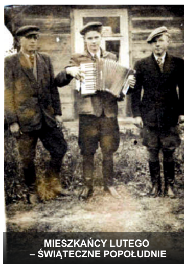
MIESZKAŃCY LUTEGO - ŚWIĄTECZNE POPOŁUDNIE

Osada o nazwie Chobrzanka istniała już 1801 r. W XIX w. utworzono tu folwark o nazwie Lute Doły o ogólnej powierzchni 350 mórg, wchodzący w skład dóbr modliborzycyckich. W 1869 r. ziemię podzielono na 10 morgowe kolonie, które po dwa ruble srebrne czynszu od morgi, oddano na 12 lat w dzierżawę kolonistom i miejscowym włościanom. W tym okresie w Lutych Dołach było 18 domów, w których mieszkało 163 osób. Ponieważ ziemia tam była gliniasta, tylko część z dzierżawców w późniejszym okresie osiedliła się tam 9 . W 1897 r. mieszkało tutaj 31 osób, natomiast w 1921 r. już tylko 28 osób. Obecnie Lute Doły, to przysiółek Lutego znajdujący się w pobliżu jaru o tej samej nazwie.