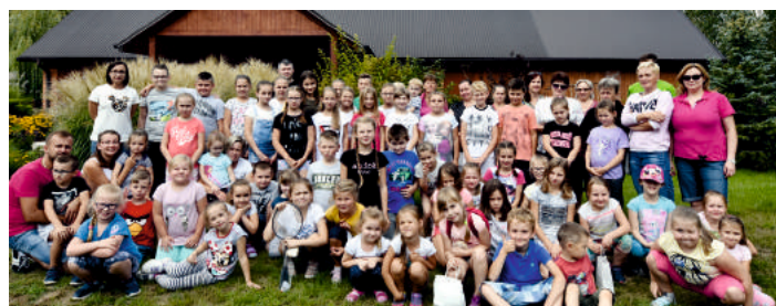
Bibliotekarki foto. Biblioteka u Kazimierza

Na zakończenie projektu „Podaruj mi radość” odbyło spotkanie integracyjne w gospodarstwie agroturystycznym Osada Leśna „Doboszówka”, położonym w obszernym kompleksie leśnym – Parku Krajobrazowym Lasy Janowskie. Podczas spotkania zorganizowane zostały warsztaty edukacyjne, wizyta w min zoo, piknik rodzinny, pieczenie kielbaski oraz wspólne gry i zabawy na świeżym powietrzu.