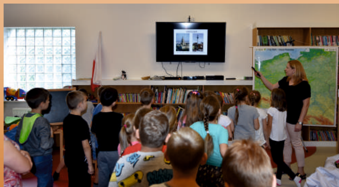
KLASA II A Z PUBLICZNEJ SZKOŁY PODSTAWOWEJ IM. ORŁA BIAŁEGO W MODLIBORZYCACH