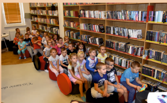
GRUPA SZESZCIOŁATKÓW Z SAMORZĄDOWEGO PRZEDSZKOLA W MODLIBORZYCACH