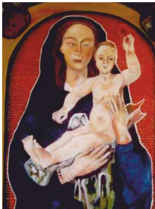
MALARSTWO OLEJNE NA PŁÓTNIE IRENA ROWICKA