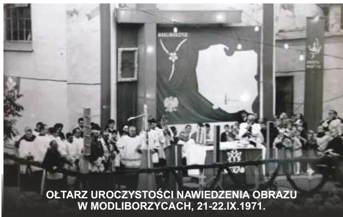
OLTARZ UROCZYSTOŚCI NAWIEDZENIA OBRAZU W MODLIBORZYCACH, 21-22.IX.1971.

Dokładnie rok później rozpoczęła się wędrówka obrazu po całym kraju, dzień po dniu - od parafii do parafii, konsekwentnie realizowana pomimo eskalowanych trudności przez komunistyczne władze. Gdy cała Polska oczekiwała na przyjazd Ojca Świętego Pawła VI na Centralne Uroczystości Milenijne, mające się odbyć 3 Maja 1966 roku na Jasnej