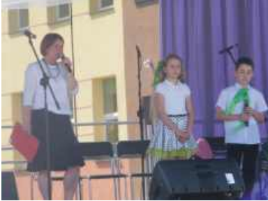
Teatralnym Szkół im. Jana Pawła II.