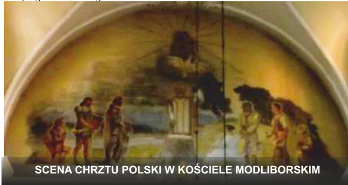
SCENA CHRZTU POLSKI W KOŚCIELE MODLIBORSKIM

"14.IV Historyczny moment Chrztu Mieszkowego i Wielkie 'Te Deum' narodu w Wielką Sobotę. Zgodnie z instrukcją Wydziału Duszpasterskiego 3 maja, gdy na Jasnej Górze odbywały się Centralne Uroczystości Milenijne, w parafii naszej o godzinie 16ej odbyliśmy procesję Maryjną do 5ciu ołtarzy rozmieszczonych na cmentarzu kościelnym, a po Mszy oddaliśmy się Matce Bożej w Niewolę Miłości za Wolność Kościoła w Polsce i na Świecie, tak jak Mieszko oddał się z Narodem Polskim Kościołowi i Ojcu Świętemu Janowi XV w 990 roku 'Dagoma Judex'. Procesja 1000 lecia z obrazem M. Boskiej i z figurą Chrystusa Zmartwychwstałego z Świecą, Otwartą Ewangelią i portretem Ojca Świętego. Pieśń 'Bogarodzica'.