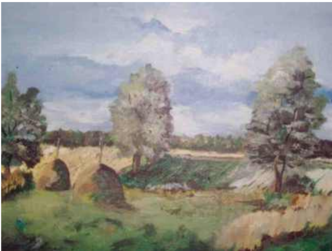
SIANOKOSY - OBRAZ OLEJNY IRENA ROWICKA